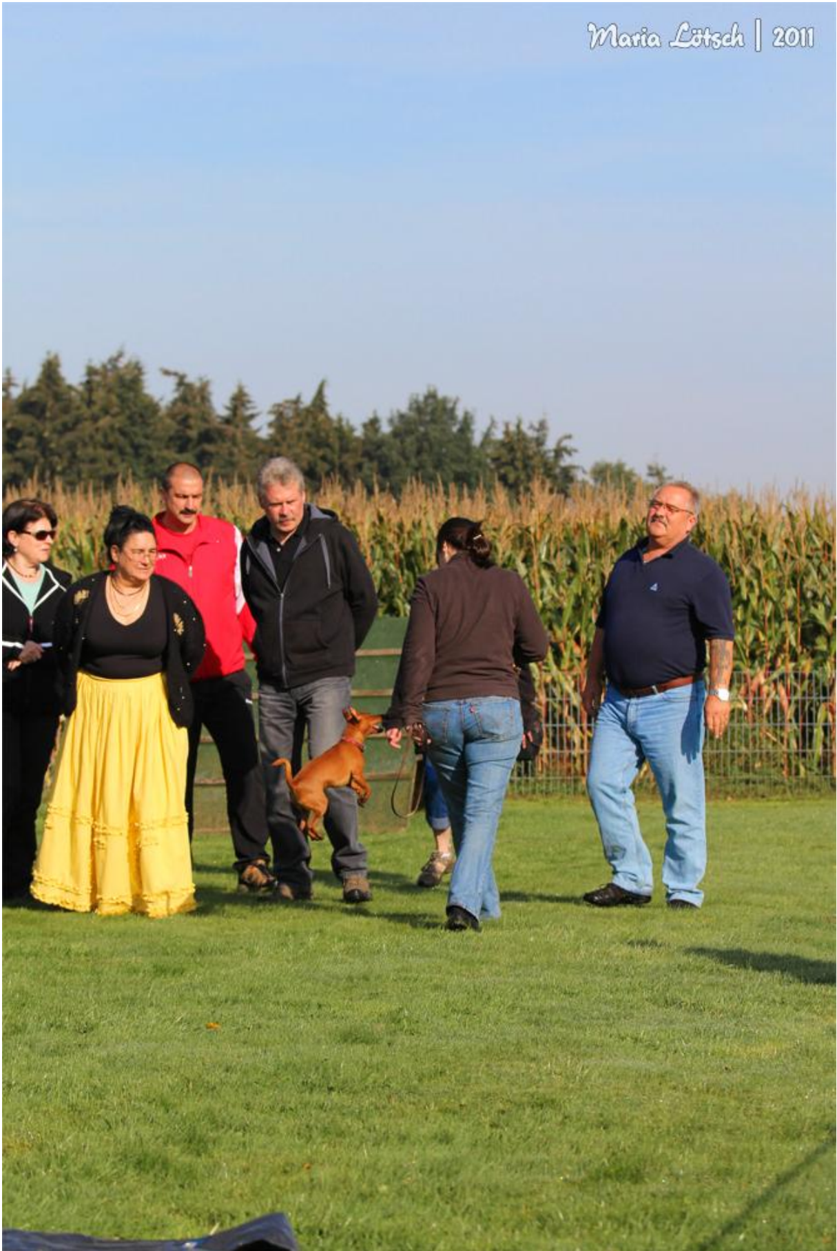
Wesenstest für die Hündin „Diamond von Veynau“