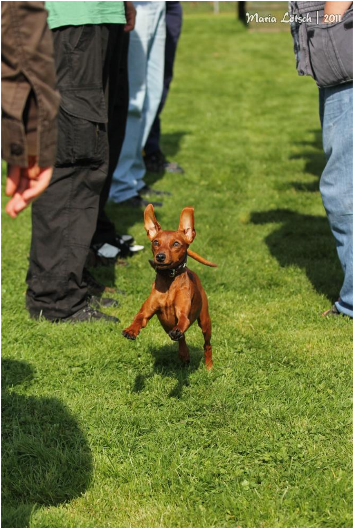
„Malea vom Schützengrund“ kommt durch die Menschengasse geflogen.